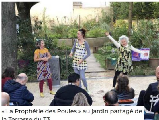
« La Prophétie des Poules » au jardin partagé de la Terrasse du T3

C'est la Compagnie Pièces montées qui est à l'initiative de cet événement. Fondée en 1990 dans le 20 e et présente dans