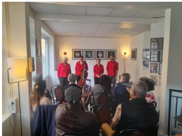
Au Café des Liens