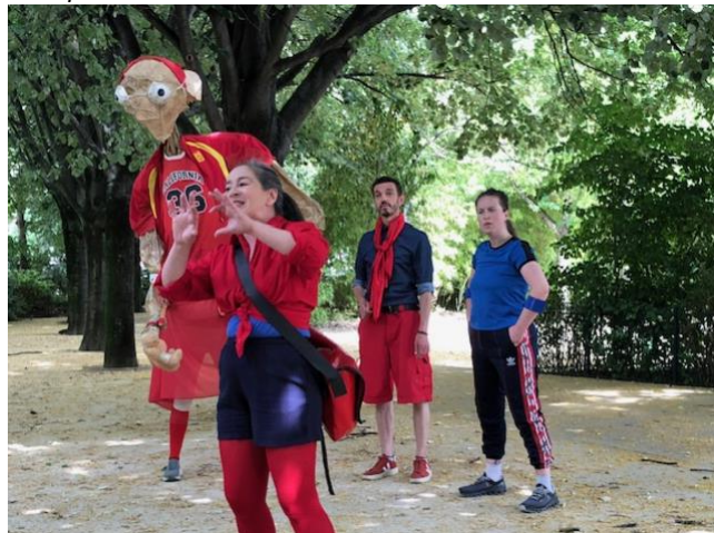
Séquence « Marie Marvingt » au square Rachmaninoff, Paris 18e