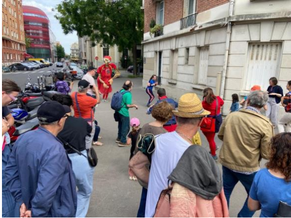
Initiation à la boxe au Festival Les Nocturbaines