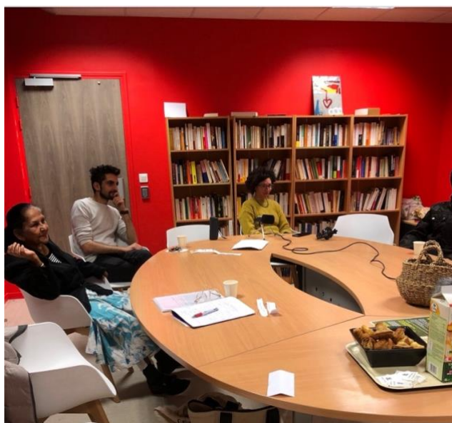
Rencontres à la résidence Albin Peyron

Les entretiens ont ensuite fait l'objet d'un montage et d'un habillage sonore (musiques originales, ambiances captées in vivo , effets sonores) afin de les transformer en une collection de podcasts. Ces podcasts ont été diffusés en 2024 dans deux cours d'habitat social des Portes du 20e, moyennant un procédé de diffusion simple (bornes sonores), implanté au cœur d'une scénographie créant une atmosphère chaleureuse. Ils ont également été mis en ligne sur une plateforme : https://open.spotify.com/show/19KbN3hy3ChMNjp4DrHK2v