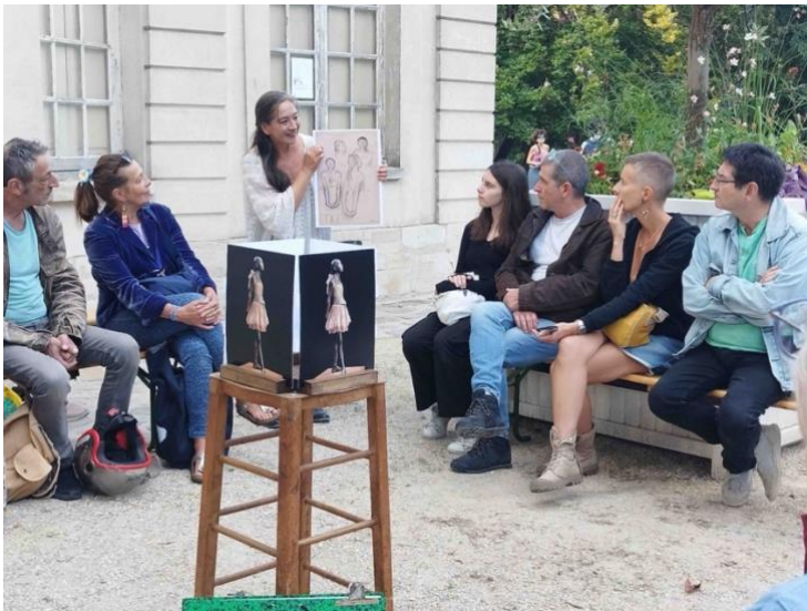
La Petite Danseuse de 14 ans de Camille Laurens au jardin de l'Hospice Alquier-Debrousse