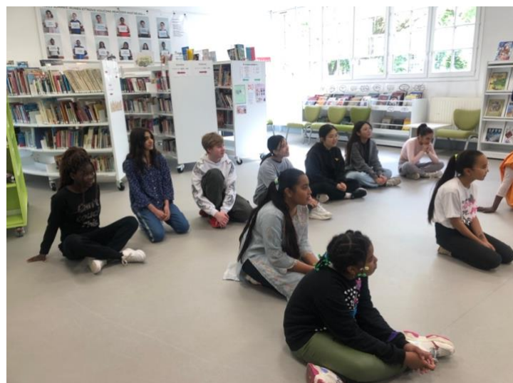
Les collégiens de la section UPE2A le 17 mai

Le travail sur le long terme a permis un beau parcours avec ces jeunes gens, mettant à profit leurs progrès dans la pratique du français au cours de l'année pour faire un travail de fond sur la poésie