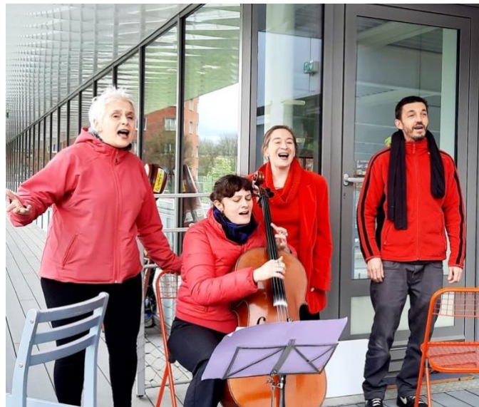
Sur le toit de la piscine Yvonne Godard