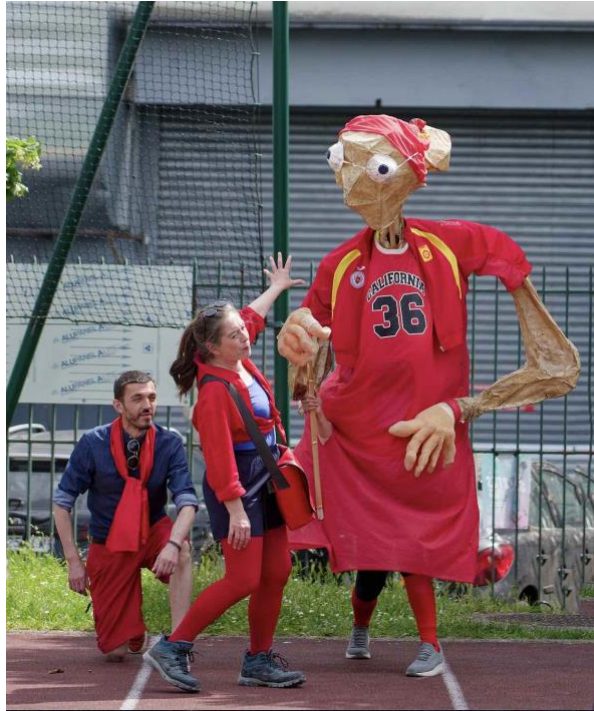
Étape de la déambulation au terrain de sport de la rue de Lagny lors du festival Les Nocturbaines

SPORTIVES ! est un parcours déambulatoire associant séquences théâtrales et séquences d'initiation sportive. Il mène le public d'un équipement sportif à l'autre pour lui présenter de façon interactive les destins de grandes figures féminines de l'histoire du sport, tout en y associant des réflexions sur le handisport et le sexisme dans le milieu sportif.