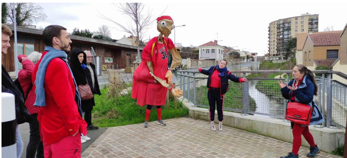
Étape en bord de Bièvre à Arcueil

Lien teaser vidéo : https://vimeo.com/887224005?share=copy