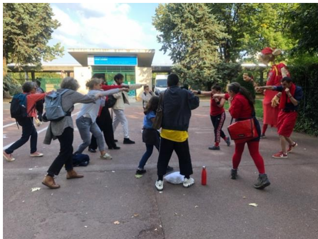
Étape au centre sportif Louis Lumière