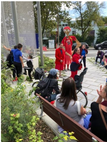
Étape au parc Aretha Franklin