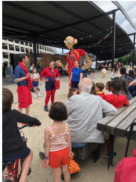
Les 29 et 30 juin au Parc Chapelle Charbon, Paris 18e