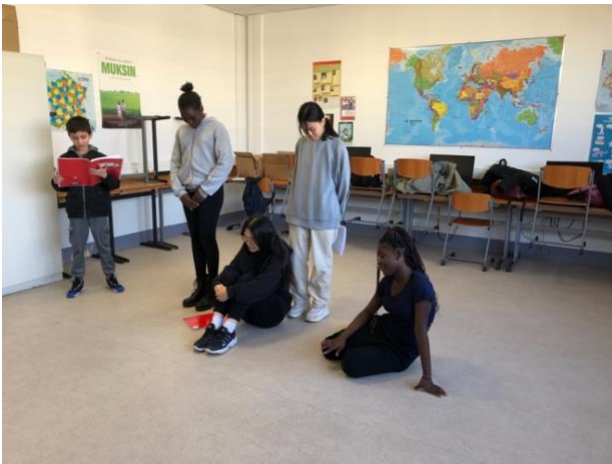
Photos de répétitions avec les collégiens UPE2A