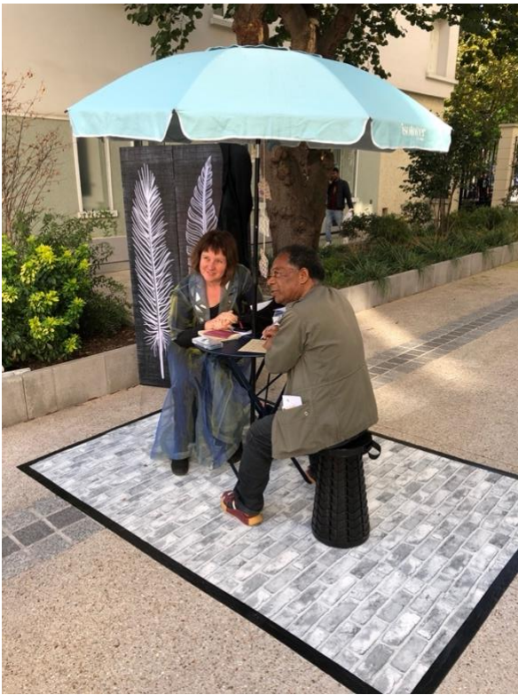
Atelier de poésie Murs, murmures de la Comédie des Anges au 4, place de la porte de Bagnolet