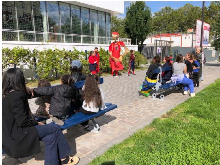
2 représentations les 14 et 18 septembre aux Portes du 20e