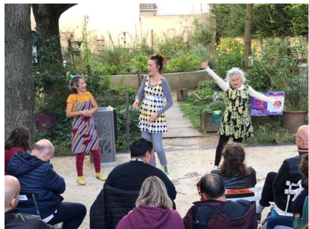
La Prophétie des Poules de la Cie 3m33 à la Terrasse du T3