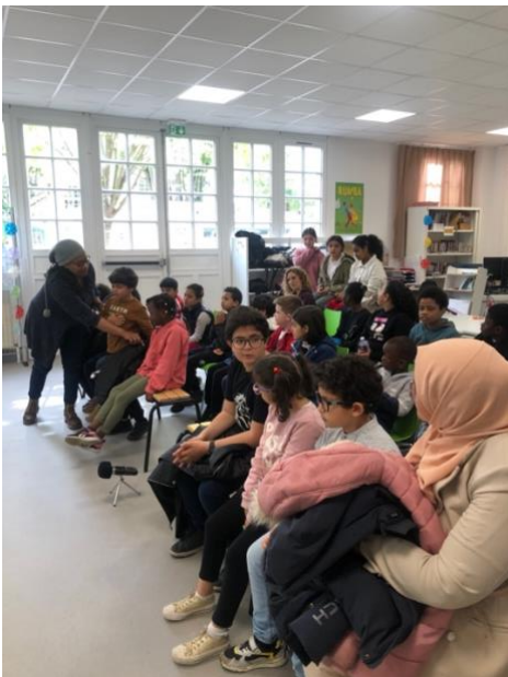
Le public des écoles élémentaires

Le 17 mai, la présentation publique des travaux s'est tenue dans le CDI du collège Henri Barbusse, devant des élèves UPE2A de l'école élémentaire Henri Wallon et de l'école de la Faïencerie de Bourg-la-Reine. Public : 24 élèves d'école primaire + 9 adultes (enseignantes et accompagnatrices)