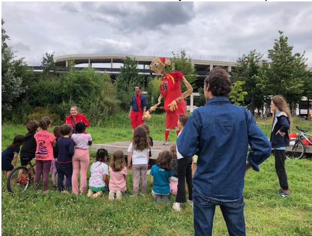
Séquence « Kathryn Switzer » au Parc Chapelle Charbon