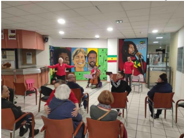
À la résidence Albin Peyron