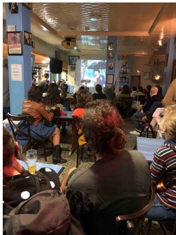
Ciné-chanté Quelques Femmes Bulles de l'association Couleur de Temps au café Le Havane.