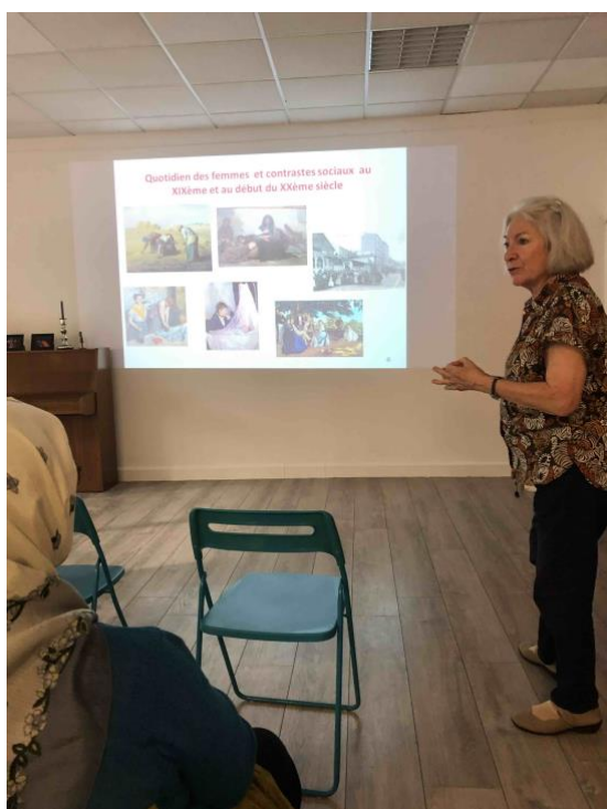
Conférence sur les 80 ans du droit de vote des femmes à la Maison des Fougères