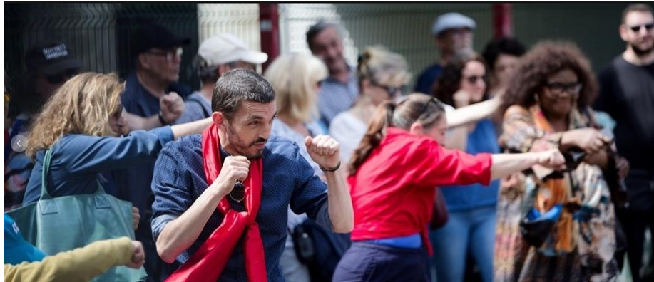
Séquence d'initiation à la boxe à Paris 20e

Comme en 2023 et en 2022, l'adhésion du public a été immédiate. Depuis sa création, ce spectacle nous a permis de toucher de nouveaux publics, d'une manière très directe et concrète. La mise en mouvement des corps et la présence de la marionnette géante ont facilité l'accès aux contenus artistiques et culturels du spectacle pour les divers publics de Paris et sa région.